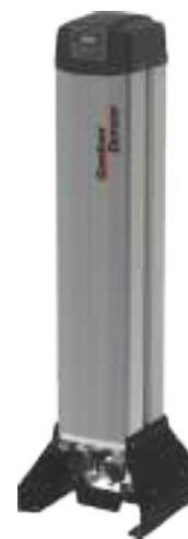
Serie da GDX7M -70 °C a GDX50M -70 °C Portata da 0,67 m 3 /min