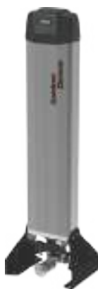
Serie da DS GDX7M -40 °C a GDX50M -40 °C Portata da 0,67 m 3 /min